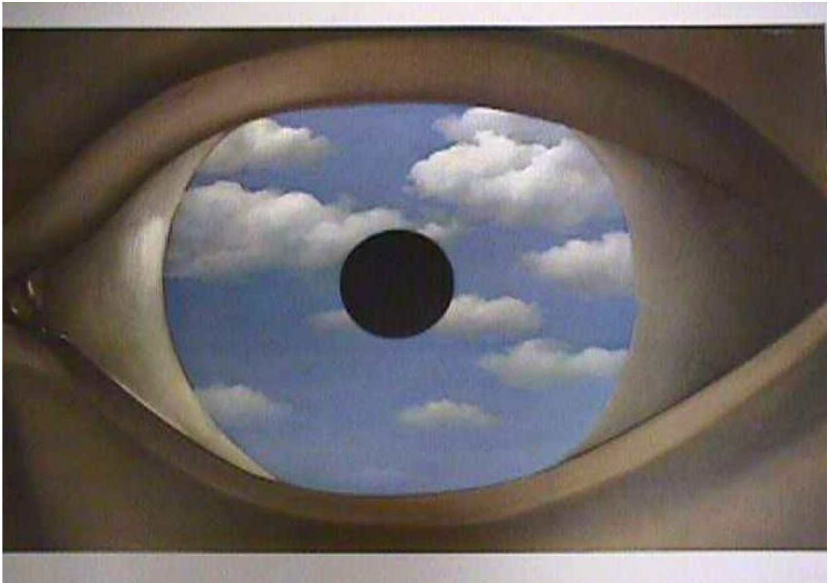
The false mirror – Magritte (1928)